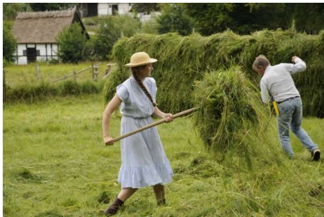
Hembygdsrörelsen/ Hela Sverige...